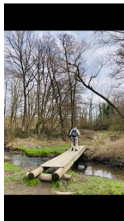
Das prämierte Foto.